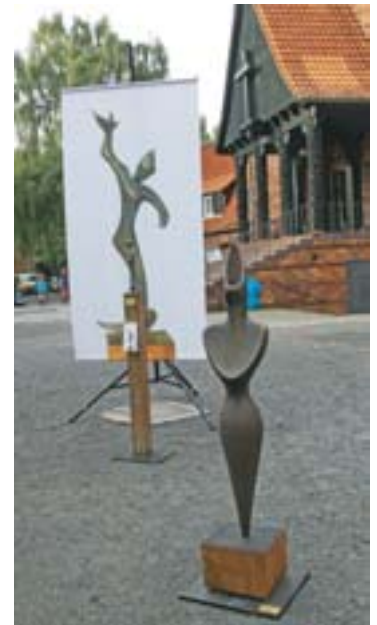
Plastiken von Bildhauer Ritter

Text & Foto: Karin Brigitte Mademann / k.ult-made (Agentur für Fotografie, Festbegleitung, Künstlervermittlung, Buch-Unikate & Schreibwerkstatt für individuelle Aufträge)