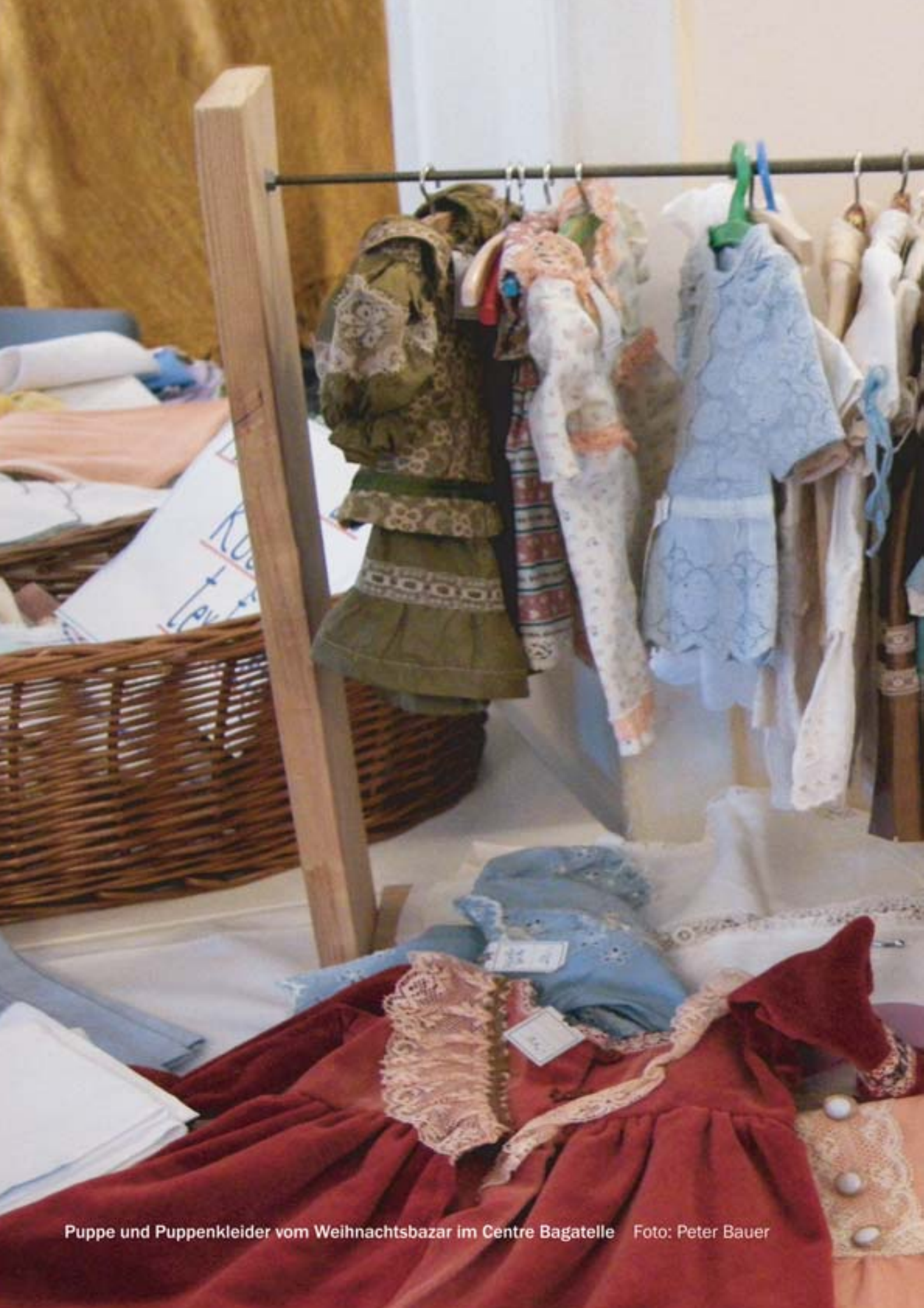
Puppe und Puppenkleider vom Weihnachtsbazar im Centre Bagatelle