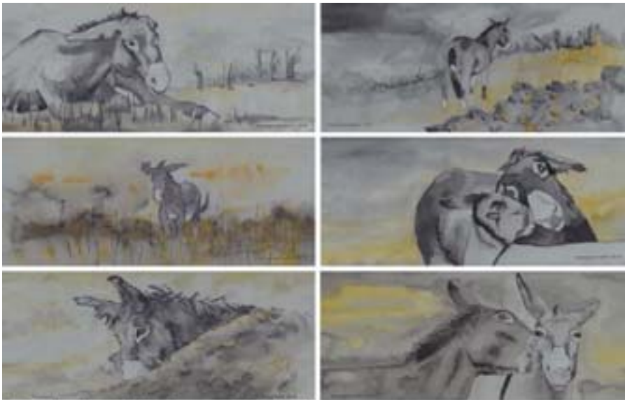
Eselreihe No. 3, Ink on Paper, about: 15 x 35 cm